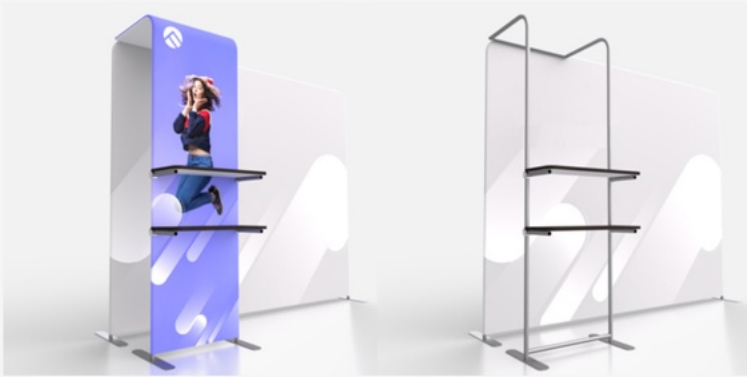
ACC2 Shelf Arch