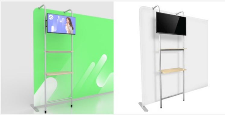
ACC1 TV Arch with Shelf