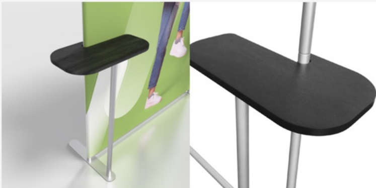
ACC4-L / ACC4-R Mini stand