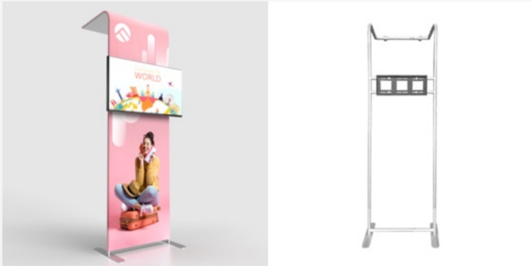
ACC3 TV Arch